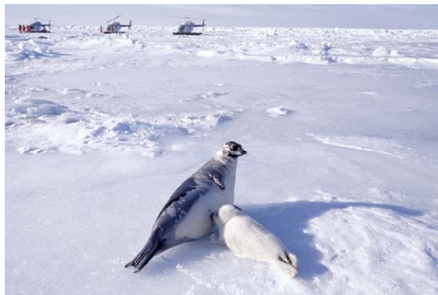
„Normale“ Eissituation anfangs März, © IFAW

Der IFAW erwartet für 2011 erneut eine sehr hohe Sterberate. Die DFO vermutet sogar, dass der traurige Rekord von 2010 gebrochen werde. Auch die erwachsenen Tiere sind in Gefahr, da die schwierigen Verhältnisse an ihren Kräften zehren. Etwas polemisch formuliert könnte man sagen, dass dem Klimawandel im Sankt-Lorenz-Golf seit 2010 mehr Tiere zum Opfer fallen als der Jagd!