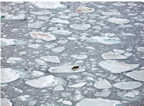
Eissituation am 8. März 2011

Der Winter 2011 ist gemäss den Statistiken von „Environment Canada“ (EC) bereits der siebzehnte in Folge, in denen die Eisbedeckung unterdurchschnittlich ausfällt. Es wird beobachtet, dass die Robben mittlerweile Ausweichmöglichkeiten suchen und dabei sogar eine äusserst unübliche Verhaltensweise an den Tag legen: Sie gebären an Land! Als Experten des International Fund for Animal Welfare (Internationaler Tierschutz-Fonds IFAW) vor einigen Tagen Erkundungsflüge über dem Sankt-Lorenz-Golf unternahmen, stellten sie jedoch fest, dass die meisten Muttertiere nach wie vor – oft vergebens – auf der Suche nach Eis sind. Diejenigen, die Glück hatten und auf Eisfelder stiessen, mussten sich mit kleinen instabilen Schollen zufrieden geben.