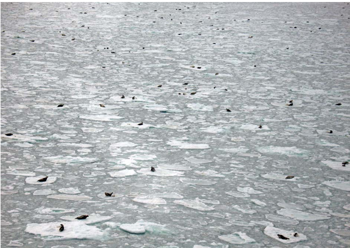
Prekäre Eisbedingungen: Erwachsene Sattelrobben im Sankt-Lorenz-Golf am 8. März 2011.

mit vorausschauenden Fragen zu der im April/Mai 2011 stattfindenden Robbenjagd